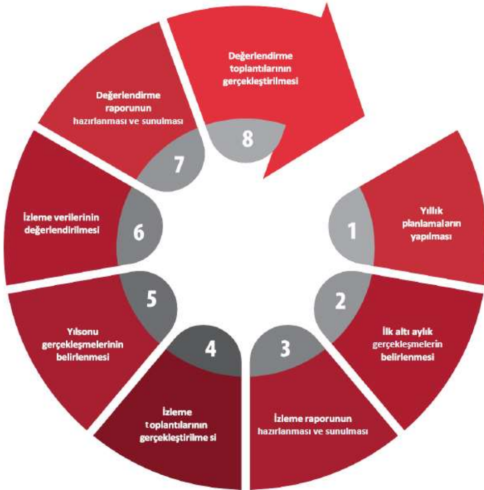
Şekil: İzleme ve Değerlendirme Süreci

İzleme ve değerlendirme sürecinin işleyişi ana hatları ile aşağıdaki şekilde özetlenmiştir: 2024–2028 Stratejik Planı'nda yer alan performans göstergelerinin gerçekleşme durumlarının tespiti yılda iki kez yapılacaktır . Ara izleme olarak nitelendirilebilecek yılın ilk altı aylık dönemini kapsayan birinci izleme kapsamında tüm amaç sorumluları, sorumlu oldukları göstergelerle ilgili gerçekleşme durumlarına ilişkin veriler “Stratejik Plan Sorumlu Müdür Yardımcısı” tarafından toplanarak performans hedeflerinin gerçekleşme durumları hakkında hazırlanan “Stratejik Plan İzleme Değerlendirme Raporu” okul müdürüne sunularak paydaşlarla paylaşılacaktır. Bu aşamada amaç; varsa öncelikle yıllık hedefler olmak üzere, hedeflere ulaşılmasının önündeki engelleri ve riskleri belirlemek ve yıllık hedeflere ulaşılmasını sağlamak üzere gerekli görülebilecek tedbirlerin alınmasıdır.